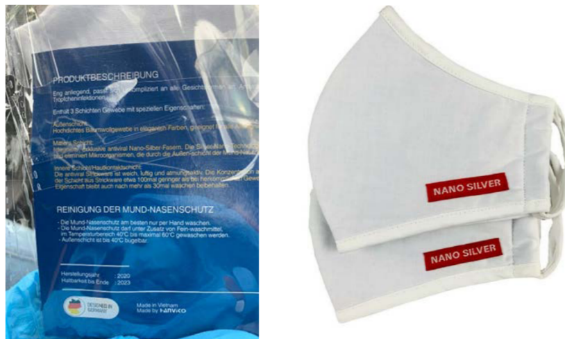
Figuur 2 Voorbeelden van afbeeldingen van (verpakkingen van) mondkapjes met nanozilver.

Colloidaal (nano)zilver bestaat uit primaire zilverdeeltjes die in de nanoschaal voorkomen. De grootte van de deeltjes kan variëren van 1 tot 100 nm. Het is een langzaam oplossend materiaal, met een oplosbaarheid van kleiner dan 0.01 mg/liter. Nanozilver heeft een antimicrobiële werking en dit zorgt ervoor dat, wanneer toegepast in een mondkapje, dit zoveel mogelijk vrij blijft van bijvoorbeeld bacteriën.